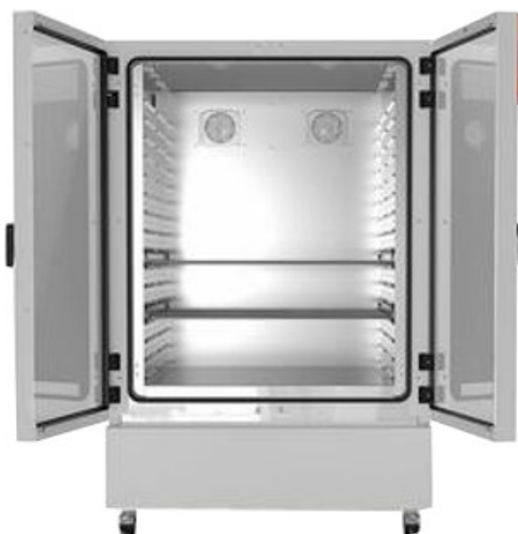
Модель KBF-S 1020